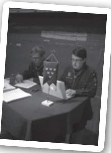
Kokouksen puheenjohtaja ja sihteeri työssään