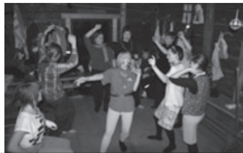
Viimeisen illan 80-luvun disko nosti tunnelman kattoon

Vihdoinkin pääsin näyttämään kykyäni, sillä talvileiriläiset puhuivat haikista. Porukka pisti kenkää toisen eteen reippaassa tahdissa ja välillä pysähtyi erilaisille rasteille. Eräällä rastilla vartiot jakoivat mielikuvitussiat