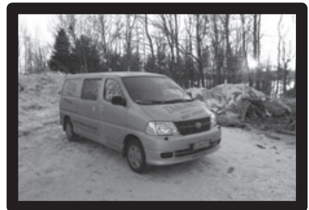
Huijaus. Voiko mihinkään enää luottaa?

Toiseksi suhteet Teboil Itäväylään jäädytetään välittömästi leirin huollon jouduttua törkeän kavalluksen uhriksi. Kyseinen Teboil vuokrasi huollon pojille nimittäin takavetoisen Hiacen nelivetoisena. Vääräys kävi ilmi paku-kun korimerkinnoista, eikä mistään muualta. Onko todellakin näin, että nykyajan Suomessa voidaan tehdä tällaista. Mitä joutuukaan viaton ihminen kärsimään voittoa kasvattavien yritysten kynsissä?