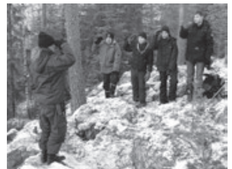
Tatun vartio ilmoittautuu haikin rastille