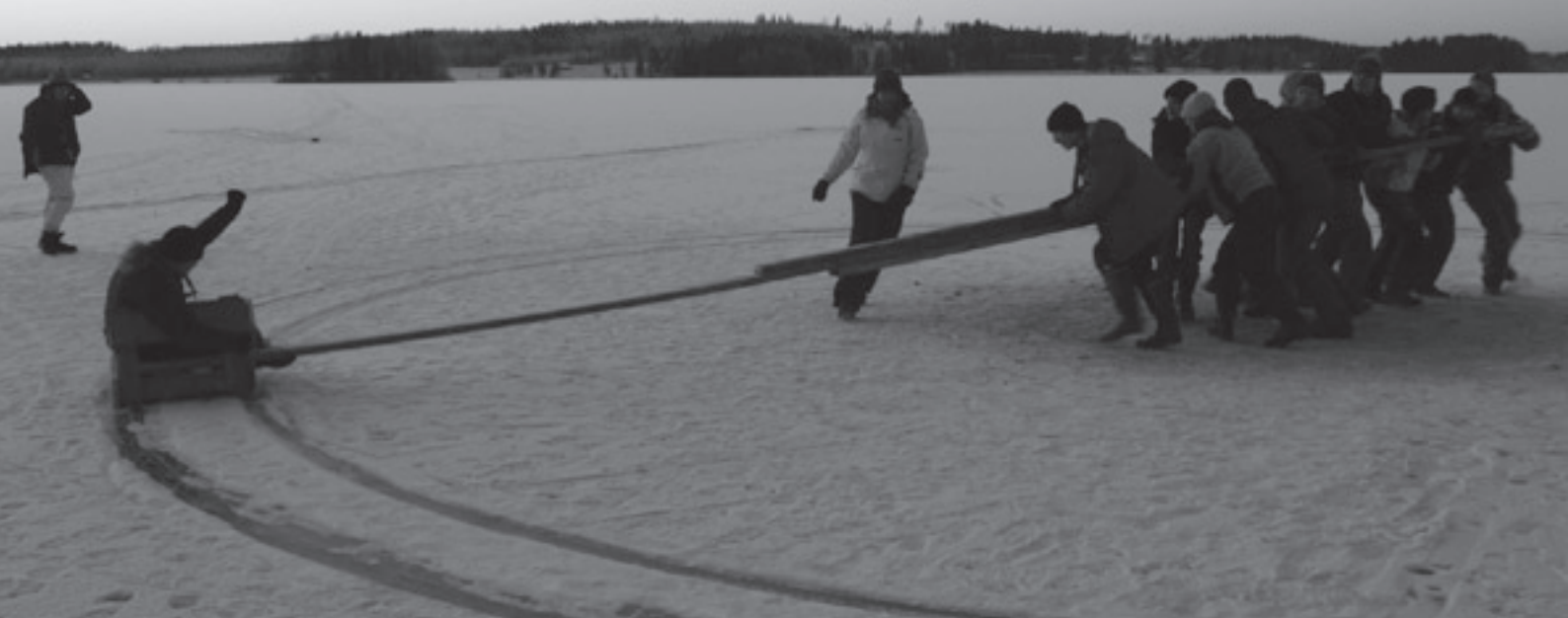
Herra leirinjohtaja saa kyytiä